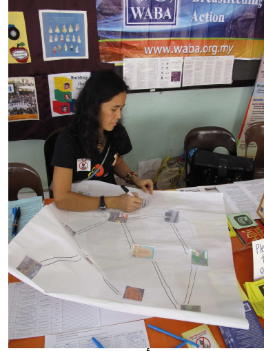
عائدة ترسم على لوحة نشاط: "أين يمكن القيام بالرضاعة الطبيعية؟"